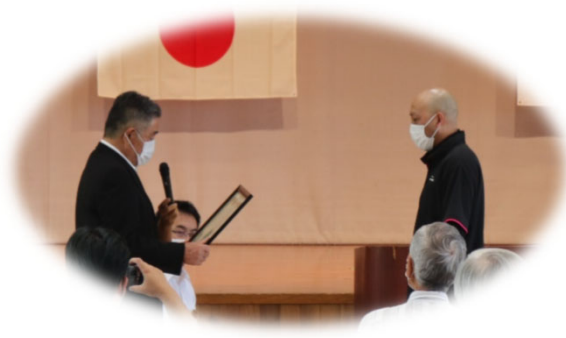
鹿児島県森林組合連合会 模範作業員表彰